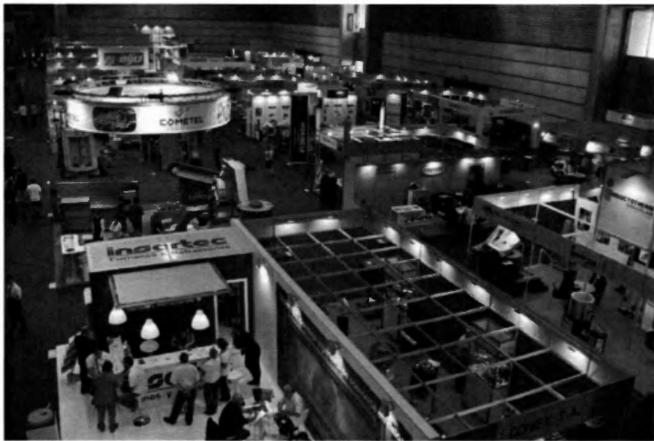
La empresa estará presente en la feria que se celebra en Bilbao.

La ingeniería vasca está presente en la feria Maintenance, en Bilbao, para ofrecer su visión del sector a través de la participación en varias jornadas técnicas. En esta nueva edición del certamen, se prestará especial atención a los retos de la fabricación avanzada y a la digitalización que acompañan a la Industria 4.0.